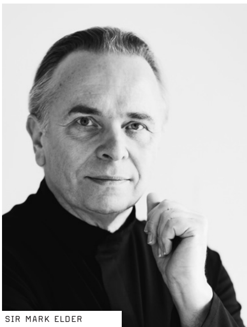
SIR MARK ELDER